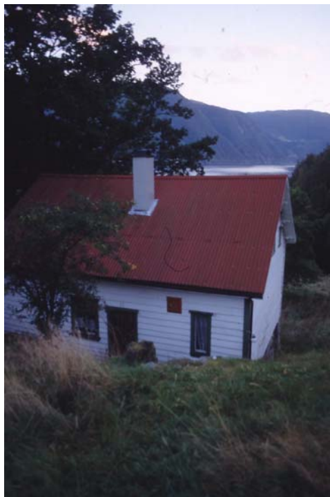
Det gamle posthuset på Bjellandnes. Posten ble nedlagt i 1965.