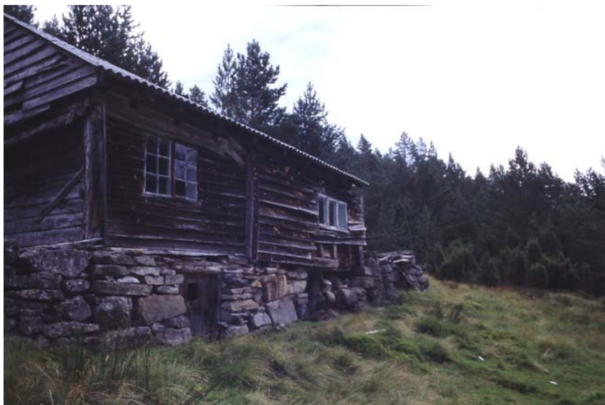
Stuen på Nygard som ble skilt ut som eget bruk i 1906. Løa har rast ned. En kjerrevei går herifra til Mosnes.