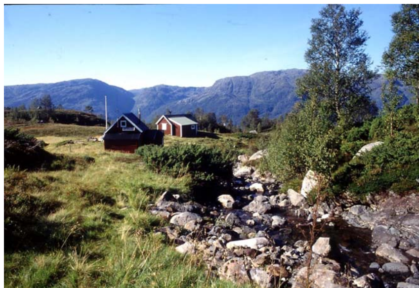
Det er to gamle seterbuer på Hetleflåtstølen. Området beites av sau.

På Hetleflåtstølen er det to gamle seterbuer som er i bra og opprinnelig stand. Ved bekken er det muligens en gammel avkjølingsplass. Området er beitet av sau. Stølsvollen domineres av engkvein med innslag av "naturengarter" som fjellmarikåpe, følblom, finnskjegg, blåbær, småsyre, kystmaure, tyttebær, krypsoleie, engsyre, myrfiol og rapp-arter.