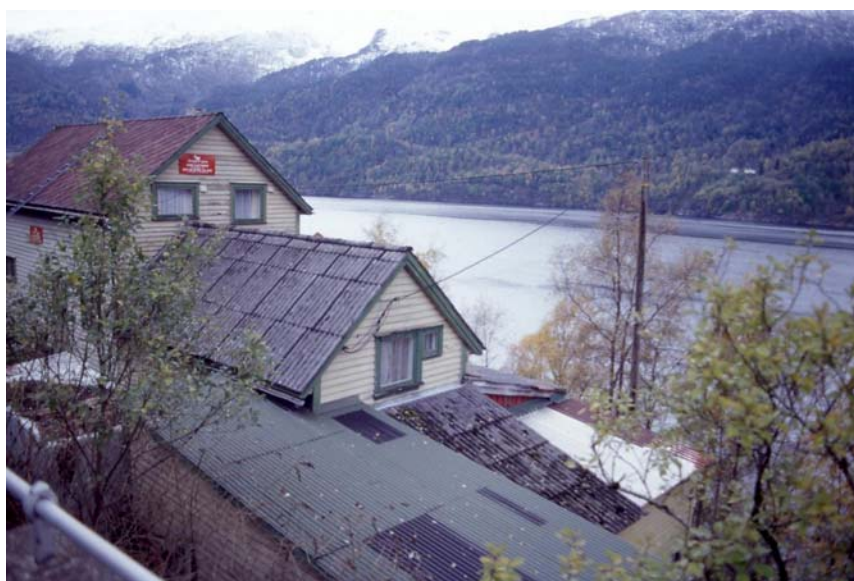
Fra cirka 1955 til begynnelsen av 90-tallet var det her pølseproduksjon. Den gamle pølsefabrikken er en spesiell bygning som forteller om tidligere næringsvirksomhet i området.