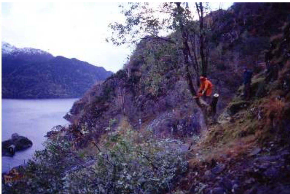
Styving på Hetleflåt.

Jeg har uten unntak møtt åpne og interesserte mennesker i Åkrafjorden. Dessverre hadde jeg ikke anledning til å være oftere i området. Jeg håper imidlertid at diskusjons- og møteaktiviteten kan økes i framtida slik at en sammen kan ta del i og ha glede av alt som skjer og som finnes i Åkrafjorden. Jeg håper at denne rapporten vil bli brukt som grunnlag for diskusjoner og ulike kulturlandskapstiltak.