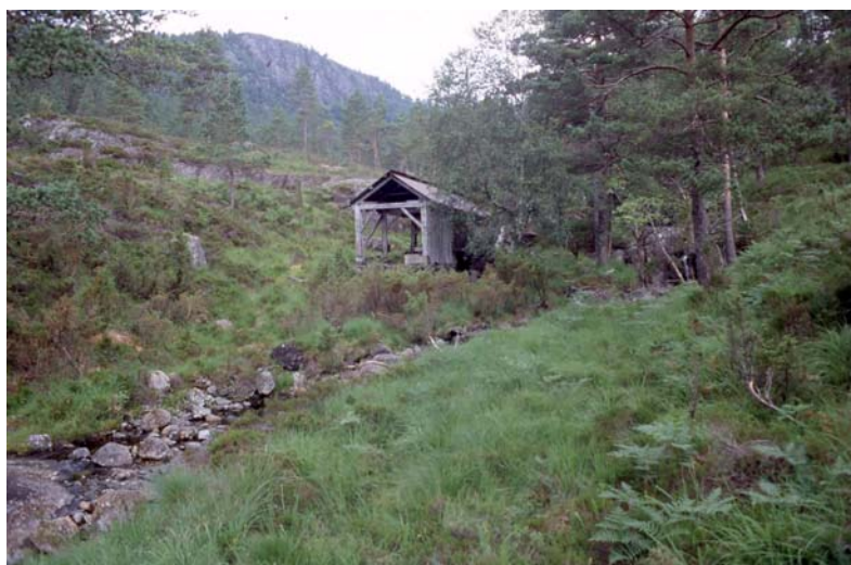
Gammelt sagbruk på Eikemo. Er det et mulig restaureringsobjekt?