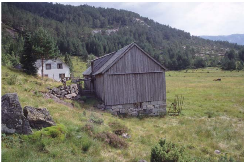
Det er to bruk på Glåmo som ble fraflytta i 1962.