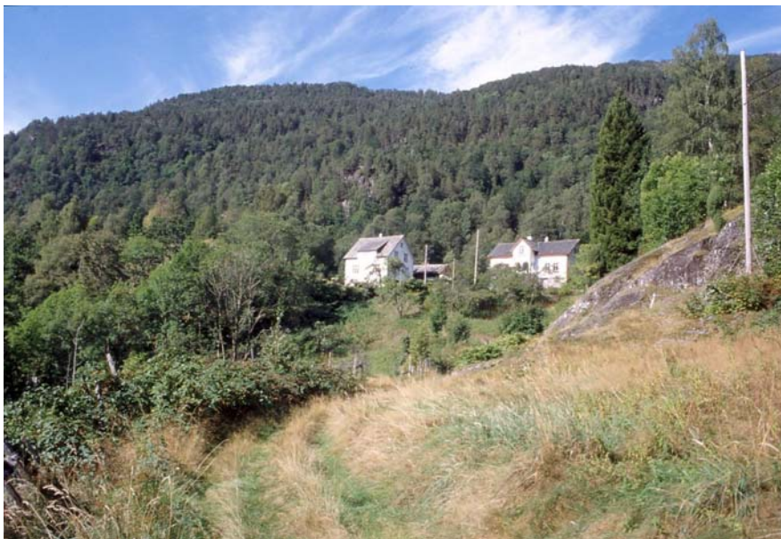
Kulturmarkene på Djuve er under tydelig gjengroing.